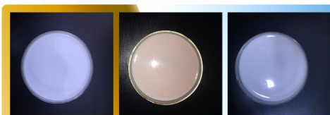
初始状态 滴入甲基橙 日光照射后分解 (实验中以“甲基橙”代表有机污染物)